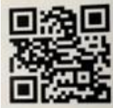
↑294マーケットへお気軽にどうぞ♪