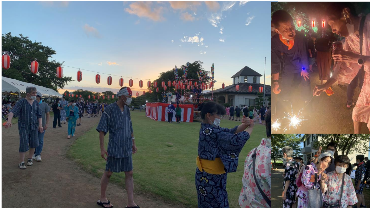
4年ぶりの授産・厚生合同夏祭り開催！ はじける花火にこぼれる笑顔 8月11日（金） 真壁厚生学園園庭にて

今年度の冬季外泊帰省も、新型コロナウイルス感染症状況により、中止となる可能性がございますので、ご理解とご協力の程宜しくお願い致します。